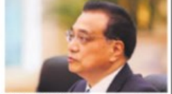
6,5 PROSENT: Kinas statsminister Li Keqiang.