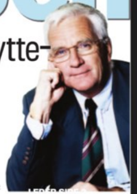
LEDER SIDE 2