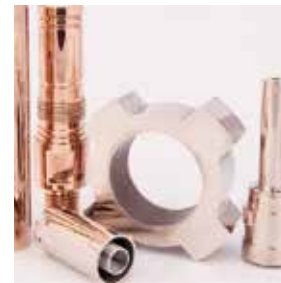
Fra Materion Brush kan vi levere blant annet ToughMet® og Copper Beryllium

Vi tilbyr også plateemner, plasma-, vann- eller laserskåret, fra våre gode samarbeidspartnere, samt smidde, støpte detaljer i rustbestandige materialer.