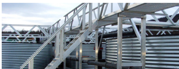
ALUFLEX selvbærende gangbanekonstruksjon og ALUFLEX Industritrapp.