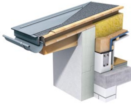
Fig. 1: Ventilert takkonstruksjon med strukturmatte